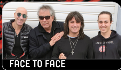
FACE TO FACE