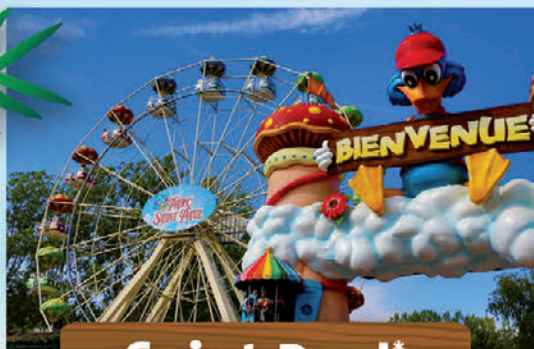
Saint Paul* 17 août