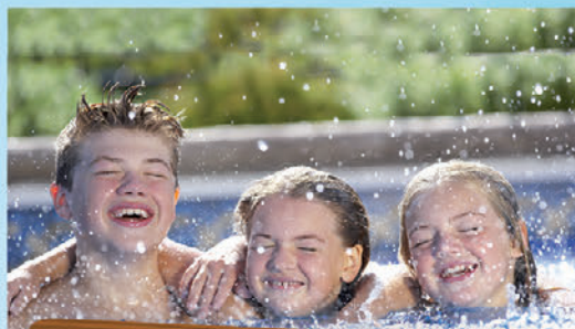
Aquaboulevard** 20 juillet