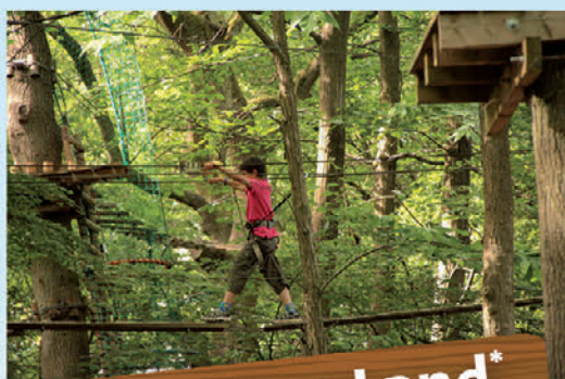
Aventure Land* 27 juillet

10 € COR IPNO COMITÉ D'ÉTABLISSEMENT RÉGIONAL SNCF MOBILITÉS PARIS NORD