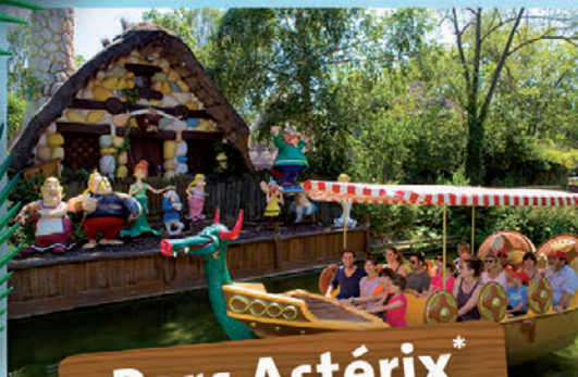
Parc Astérix* 6 juillet et 3 août